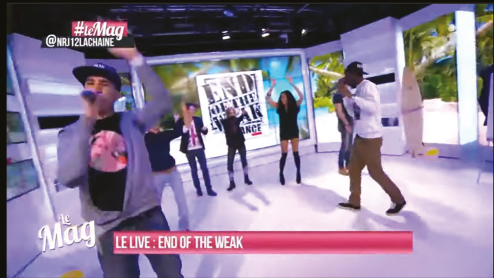
le Mag LE LIVE : END OF THE WEAK